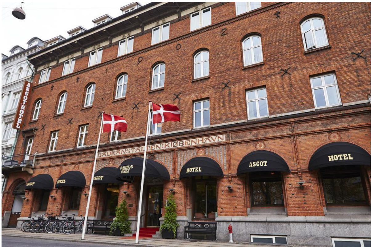
Aussenansicht des Hotels