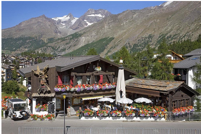
Rest. Zur Mühle

Nach Ankunft begeben wir uns zum Hotel Garni Feehof und beziehen unsere Zimmer. Um 19.00h werden wir im Restaurant Mühle zum Abendessen à la carte (auf eigene Rechnung) erwartet. Ein urchiges Walliserrestaurant mit einem sympathischen Wirtepaar ☺.