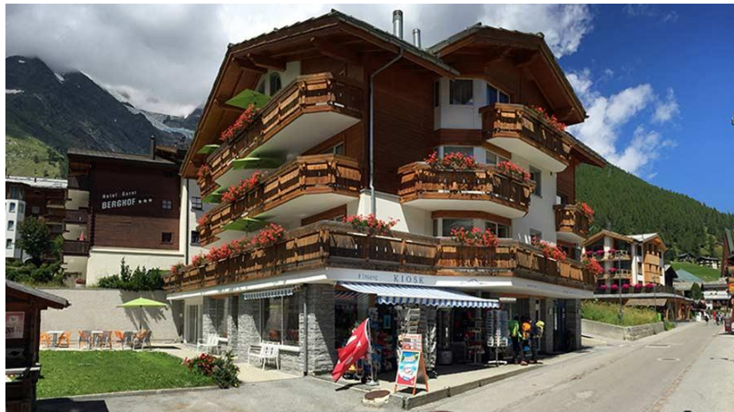
Hotel Garni Feehof

Nach Ankunft begeben wir uns zum Hotel Garni Feehof und beziehen unsere Zimmer. Um 19.00h werden wir im Restaurant Mühle zum Abendessen à la carte (auf eigene Rechnung) erwartet. Ein urchiges Walliserrestaurant mit einem sympathischen Wirtepaar ☺.